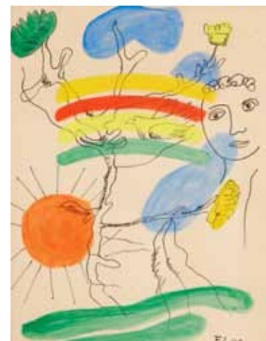
Dessin de Fernand LÉGER ayant servi d'illustration pour les Illuminations de Rimbaud, éditions Louis Grosclaude

1, cité Bergère 75009 Paris Elvire Poulain Marquis elvirepoulain@gmail.com T +33 (0)672 38 90 90 www.poulainlivres.com