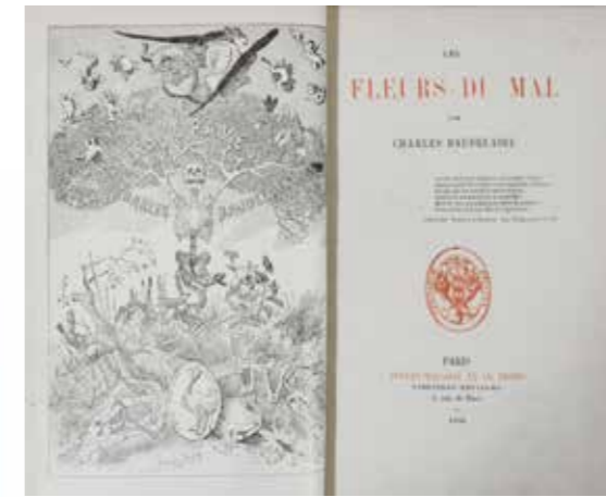
BAUDELAIRE (Charles) Les Fleurs du Mal . Rarissime édition originale avec le titre et la couverture renouvelés (à la date de 1858). Superbe exemplaire dans une reliure signée de MEUNIER, truffé du frontispice de Rops pour Les Épaves , de la suite complète des 9 planches d'Odilon REDON et de la suite complète des 10 eaux-forts d'Alex. HANNOTEAU.